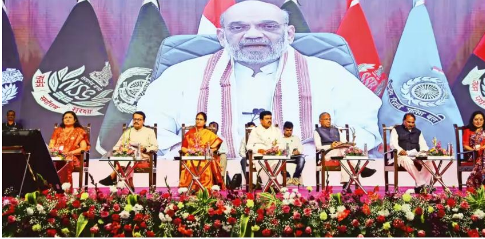
मंचासीन राजभाषा हिन्दी के विद्वान जन उदघाटन सत्र के दौरान माननीय गृह मंत्री श्री अमित शाह जी का हिन्दी दिवस संदेश सुनते हुए

इस भव्य सम्मेलन में मंचासीन विशिष्ट अतिथियों जैसे कि श्री अजय कुमार मिश्रा, माननीय गृह राज्यमंत्री, श्री हरिवंश, उप सभापति राज्यसभा, श्री भर्तृहरि महताब, उपाध्यक्ष संसदीय राजभाषा समिति जैसे राजभाषा के विद्वान उपस्थित हुए जिनकी गरिमामयी उपस्थिति में राजभाषा पुरस्कार प्रदान किए गए।