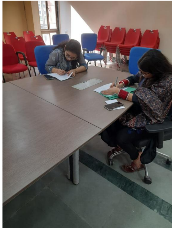
प्रतिभागियों का मूल्यांकन करते हुए वाद-विवाद प्रतियोगिता की जूरी पैनल