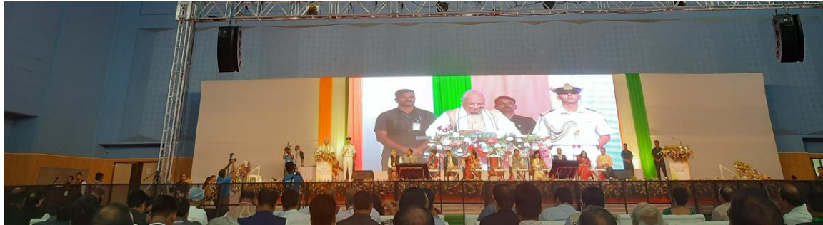
सम्मेलन के दूसरे दिन केरल के माननीय राज्यपाल श्री आरिफ मोहम्मद खान राजभाषा हिन्दी के महत्व पर वक्तव्य देते हुए