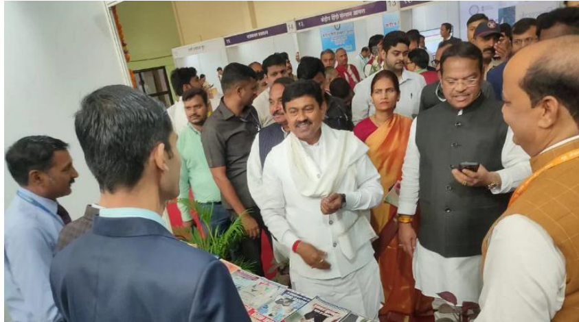
हिन्दी सम्मेलन में पुस्तक प्रदर्शनी का अवलोकन करते हुए केंद्रीय गृह राज्य मंत्री श्री अजय मिश्रा