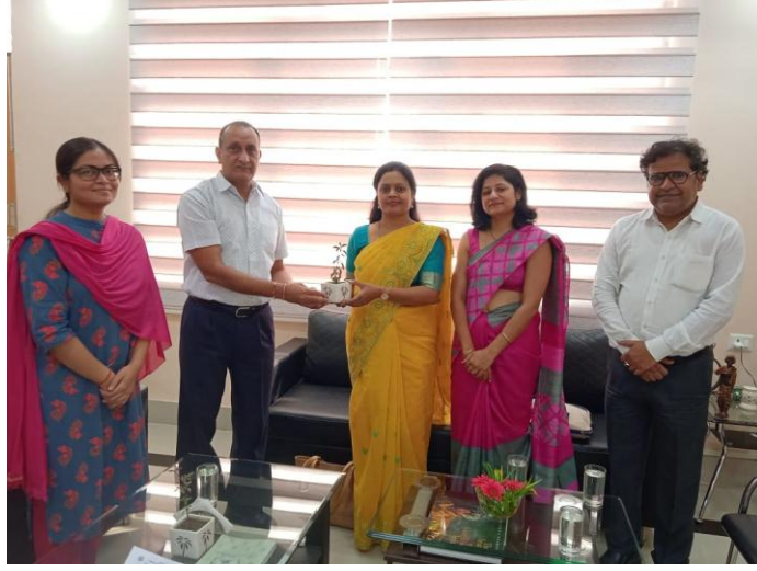
निदेशक महोदय व संयुक्त निदेशक महोदय आयुर्वेद चिकित्सकों का स्वागत करते हुए