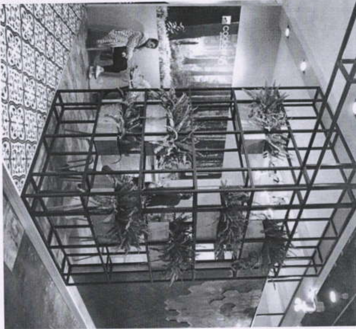
Open Cabin with Partition as shown in